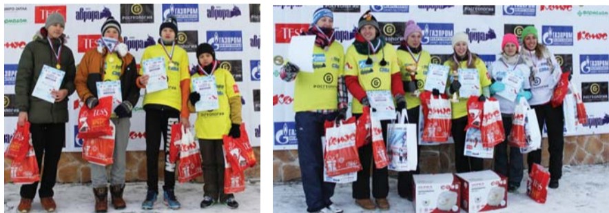
Победители и призёры соревнований среди юниоров и девушек