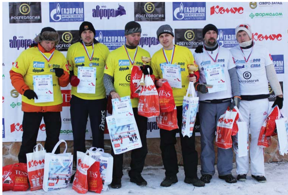
Победители и призёры в номинации «Профессионалы-мужчины»

В 13 часов в борьбу вступили команды, зарегистрировавшиеся в номинациях "Любители" и "Юниоры". 24 команды любителей — это не меньше, чем в прошлые годы. Их совсем не испугал мороз. А юниоров, по понятным причинам, было меньше, чем в прошлом году. Можно понять родителей, которые боялись отпустить своих детей из дома в такой холод. Тем не менее, приехали 8 команд девочек, из них три команды из карельского города Сортавала, и одна команда мальчиков.