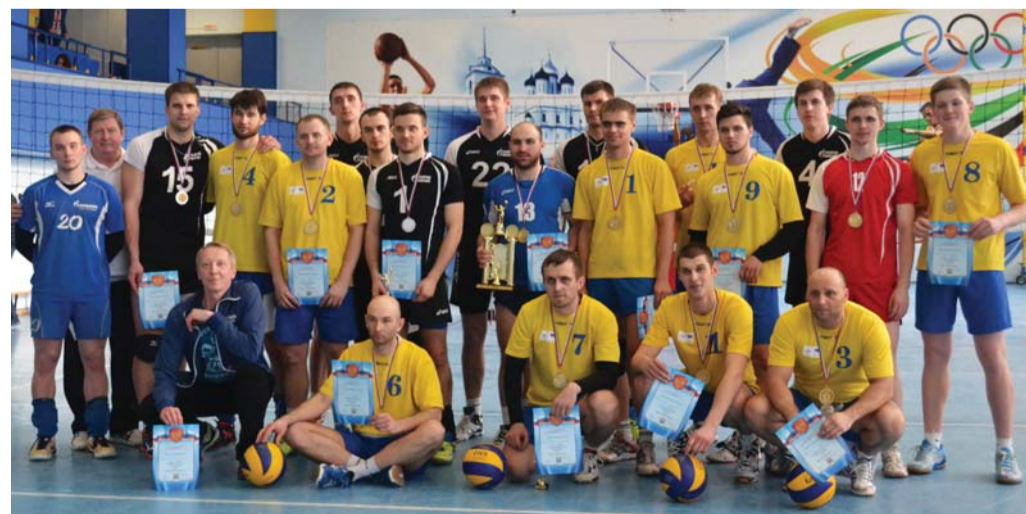
Участники финального матча первенства СЗФО – команды Пскова и Петербурга

Третье место заняли представители Вологды, четвёртой стала команда «Северный флот» из Североморска, далее в таблице расположились команды из Ладейного Поля и Карелии соответственно.