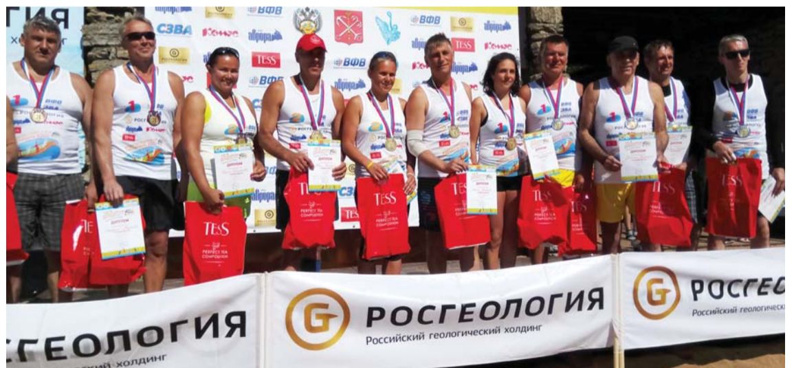
Победители и призеры Фестиваля в номинациях «VIP» и «Чайники» (внизу)