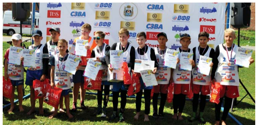
Победители и призёры Фестиваля среди мальчиков и девочек младшей возрастной категории