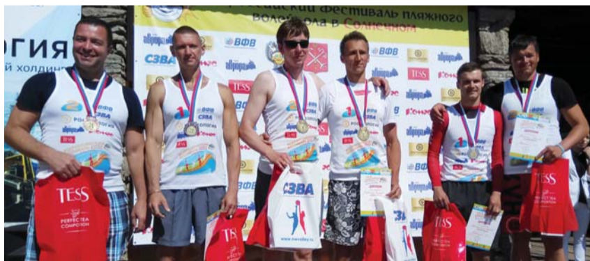
Победители и призеры среди любительских команд